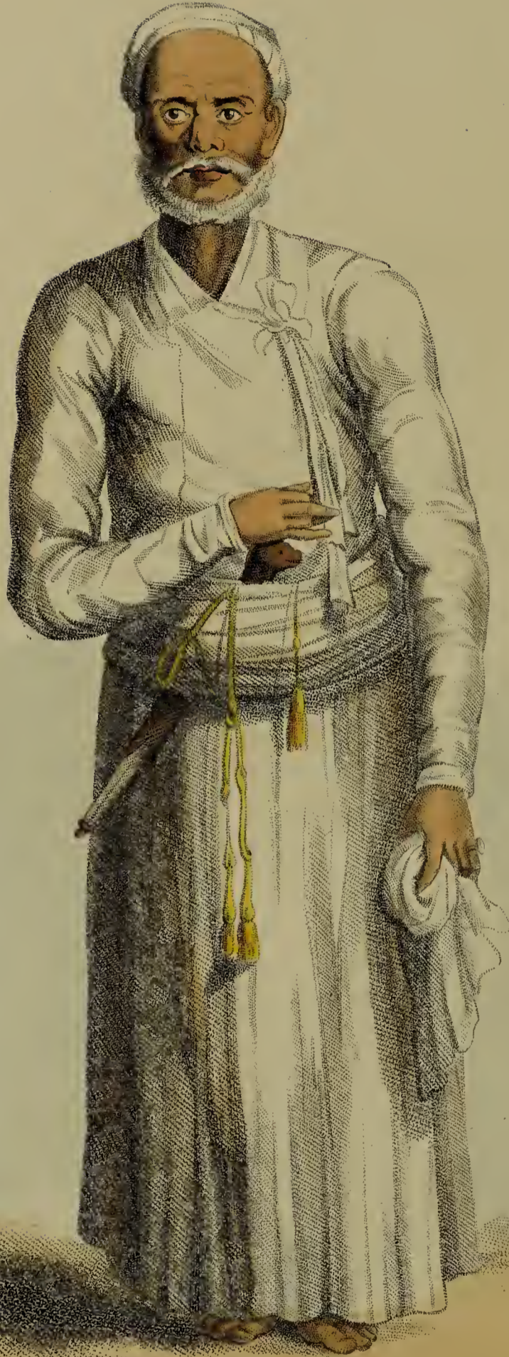
Chal. Solingns pino. Calcutta.